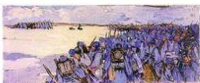
Nord d'Arras, 5 juillet 1915, Mathurin Méheut.